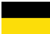
Drapeau de Namur