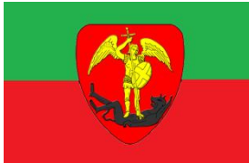
Drapeau de Bruxelles