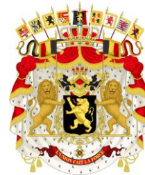
Armoiries de la Belgique