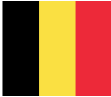
Drapeau de la Belgique