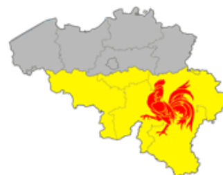
Carte de la Wallonie